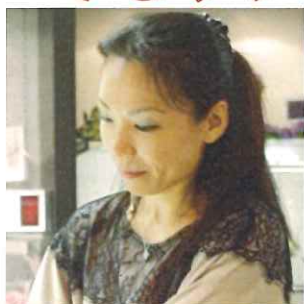
「アーティシャルフラワー」

質が良い、枯れない花で、近年生花よりも注目されています。お子様も作れて、プレゼントとしてお渡し頂けるものになっているので、9月19日の敬老の日に向けてお孫さん・お子さんとご参加ください。